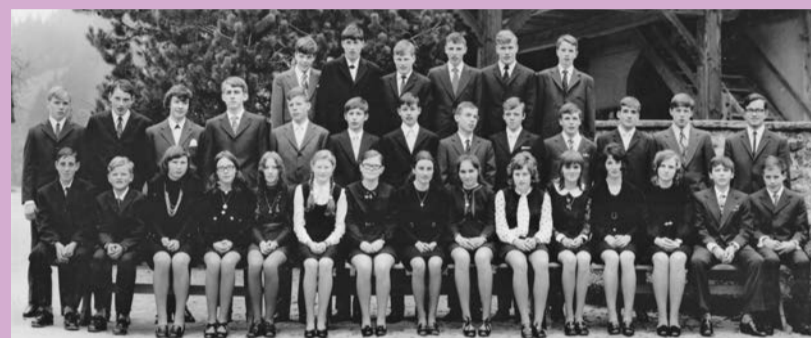
Goldene Konfirmation am Palmsonntag, 10. April, 9.30 Uhr in der Kirche Trub