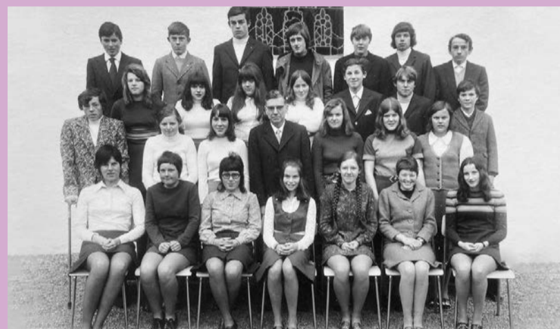
Goldene Konfirmation am Palmsonntag, 10. April, 9.30 Uhr in der Kirche Trubschachen