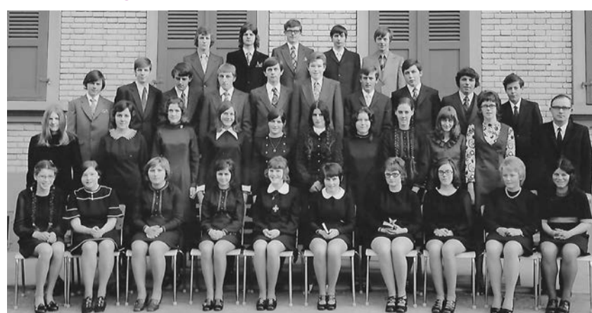
Konfirmantinnen und Konfirmanden im Jahr 1972

am Palmsonntag, 10. April 2022, 9.30 Uhr in der Kirche Rüderswil