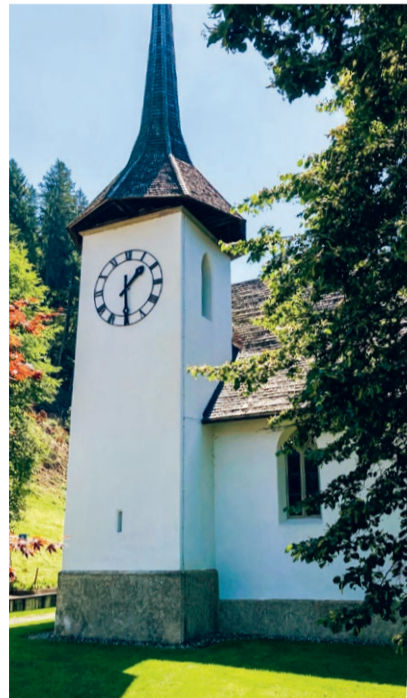
Kirche Eggiwil