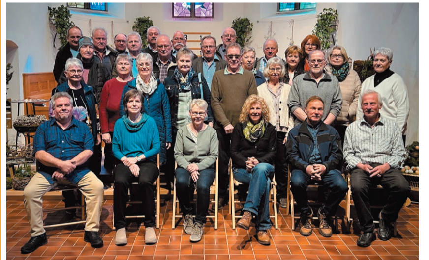
Die ehemaligen Konfirmandinnen und Konfirmanden