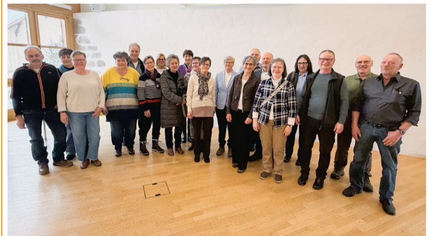
Goldene Konfirmation Trub am Palmsonntag, 29. März 2026.