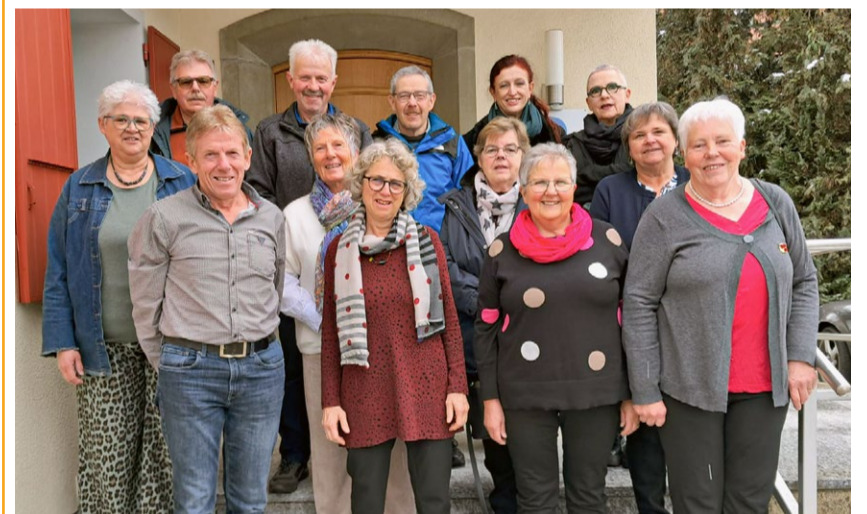
Goldene Konfirmand:innen Trubschachen 2026.