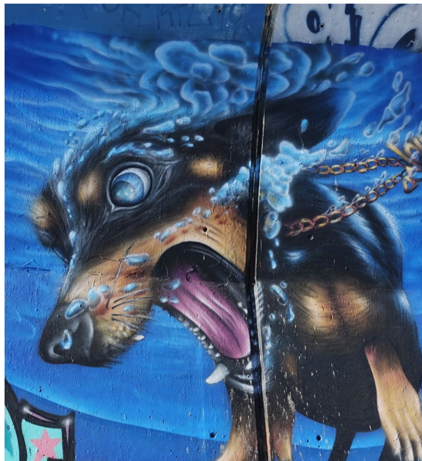
GABRIELE SCHNABEL, GRAFFITI, PIXELIO.NET

Wenn alles nach mir ginge, wäre es so viel einfacher! Denn, glaubt es mir, ich habe erkannt, wo's hapert! Ich habe die Defizite unserer Zeit begriffen. Ich kann genau sagen, wo die Probleme liegen und vor allem: Warum sie da liegen!