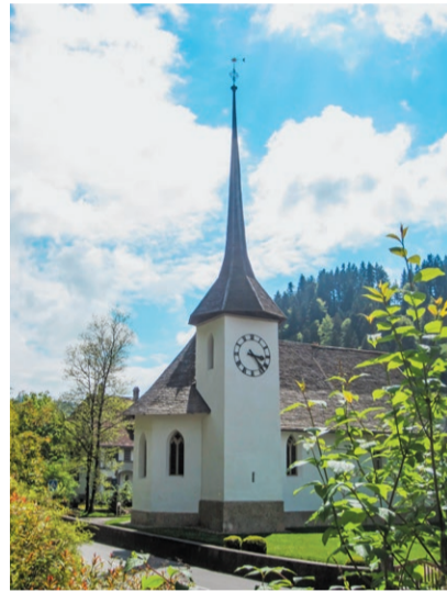
Kirche Eggiwil

Sonntag, 3. Mai, 9.30 Uhr Familien-Gottesdienst mit Abendmahl der 5. Klasse mit Katechetin Ruth Bischoff in Horben Predigt: Rahel Dahinden Mobile: 079 678 89 81